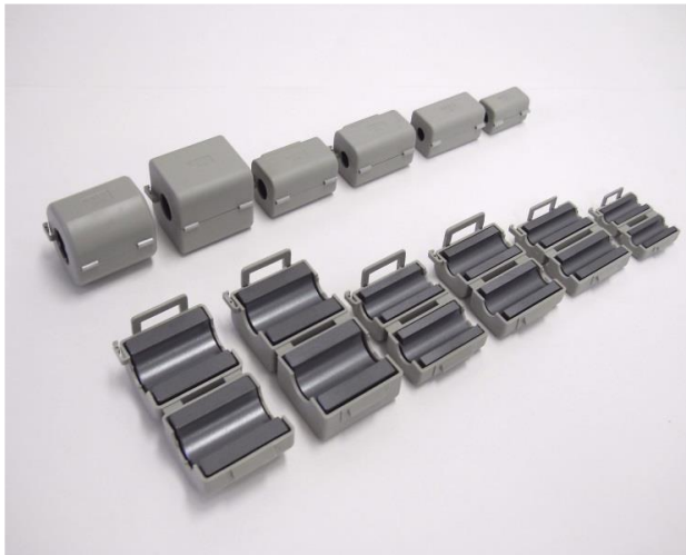
樹脂ケース材質: PA66(ナイロン)UL94 V-0 色: グレー